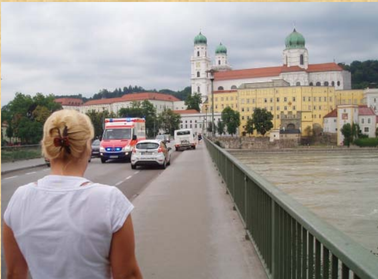
In Passau auf der Brücke, hier ändert sich auch das Wetter