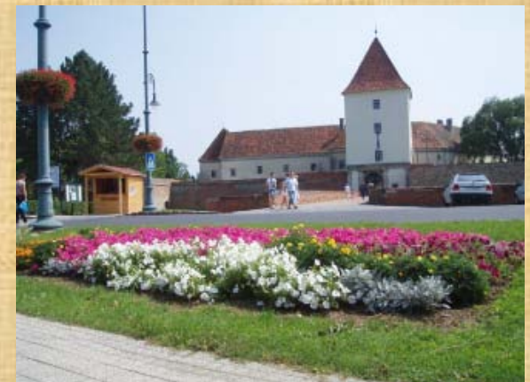
Dieser Kreisverkehr ist kurz vor Sárvár, danach geht es vorbei am bekannten Heilbad und der schönen Burg