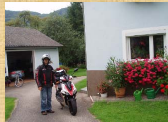
Unerwartet ein Schild „Privat Zimmer“. Nach Inspektion, stelle ich den Roller in die Garage und posiere vor dem Gästehaus in A-4081 Hartkirchen.