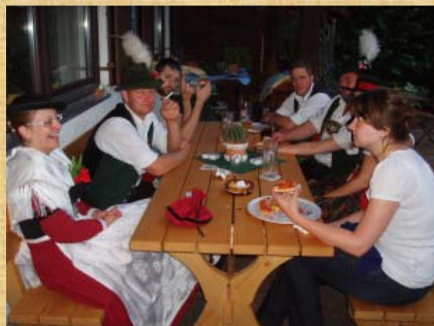
Der mit der Zigarette wollte beim Chef Punkte machen!