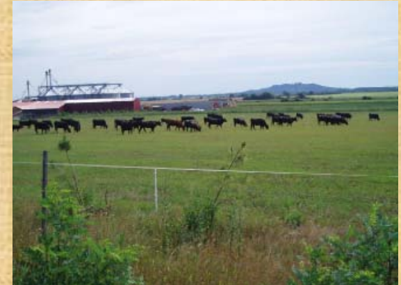
Weg nach Sárvár, leere Strassen und Landschaften, kleine Dörfer und nur eine grosse Landwirtschaft