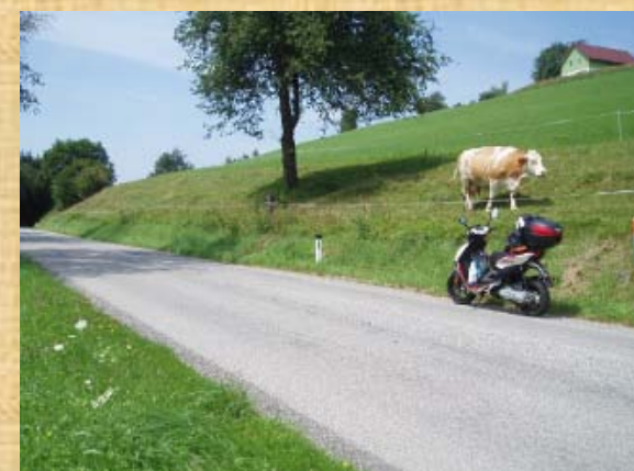
Die Landschaft nach Klingbach ist einsam. Bild in der Mitte zeigt meine Verwirrung, zwei Wege zum Ziel „Mank/Kilb“. Dem Rind ist es auch egal...

Jetzt nimmt das Verkehrsaufkommen stetig zu, so sehr, dass ab der Region Günselsdorf (vor Berndorf und Autobahnzufahrt) ein zügiges Vorankommen nicht mehr möglich ist, es folgt Stau nach Stau. Die vielen Einkaufsmöglichkeiten (Ein- und Ausfahrten), diverse Ampelanlagen, schleichende Traktoren und Strassenunterhaltsdienste, halten den flüssigen Verkehr auf. Ab Pottenstein wird es besser, allerdings bleibt das Verkehrsaufkommen im Westen nun stets auf hohem Niveau. 3-mal habe ich mich hier verfahren, da anstelle der Strassen-Nummern, nur die Namen der Ortschaften aufgeführt sind.