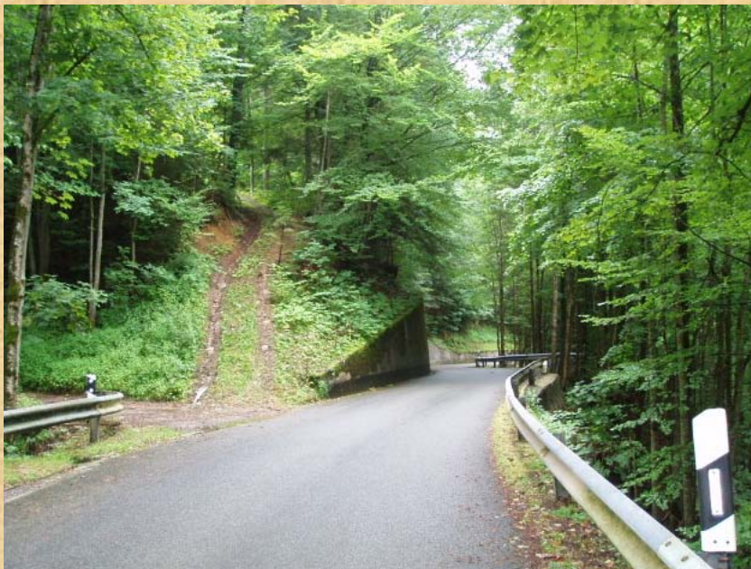
In Österreich nahe Fischbach, es geht rauf und runter

Um 05:00 Uhr war es soweit, es war heller und es hat nicht mehr geregnet. Ich fuhr nun weiter Richtung Ungarn.