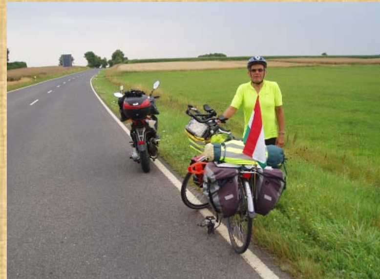
Nach Passau und vor Neumarkt treffe ich auf einen Lanzmann!