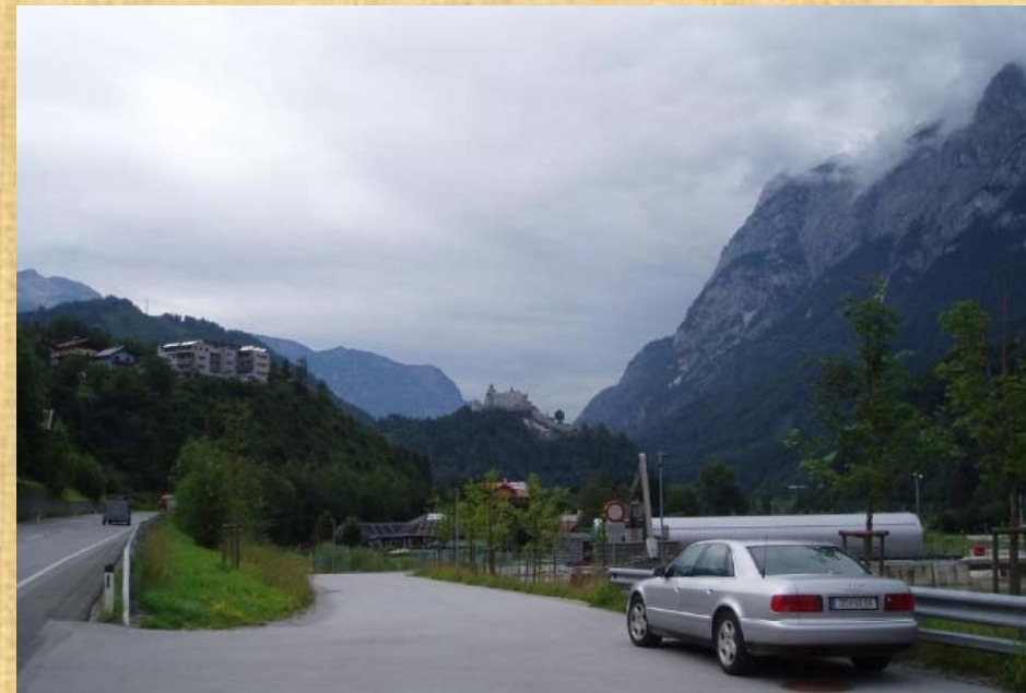
In Österreich nahe Liezen, im mache Fahrt