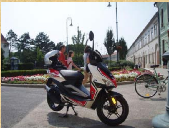
In Sárvár noch kurz zur Post, danach geht es durch Dörfer (Kugel ist Wasserspeicher) zu den Dächern über Sopron