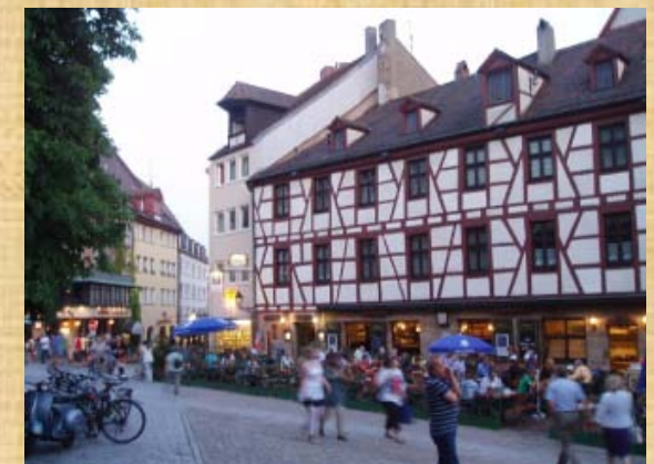
In Nürnberg in einer Seitenstrasse liegt dieses Schmuckstück, Christkindlmarkt ohne Schnee auch schön sowie die vielen Gaststätten mit vielen Menschen