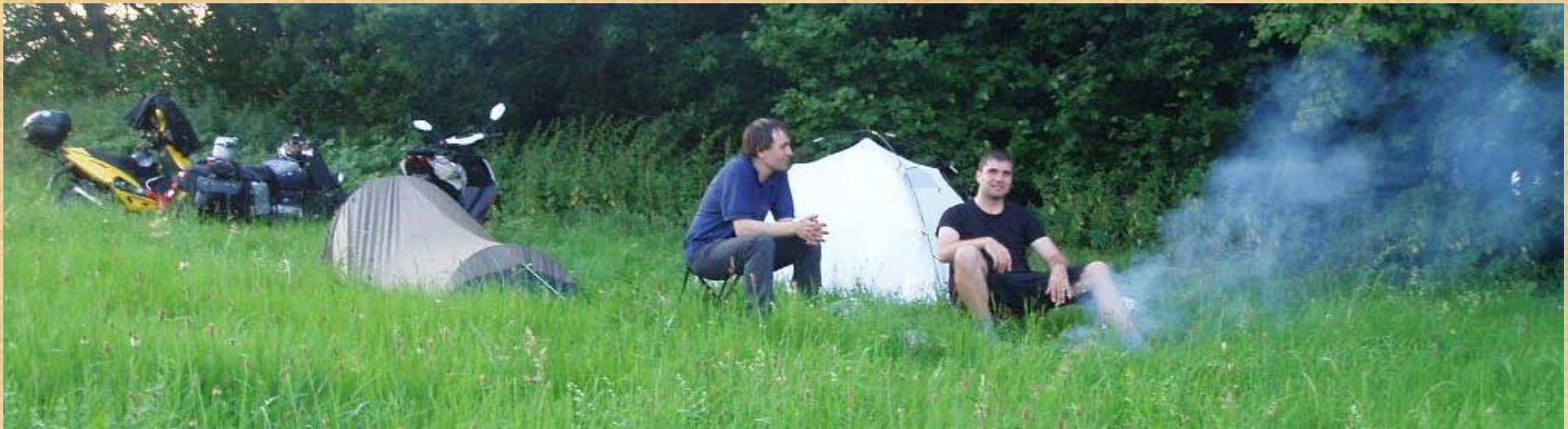
Dieses Foto zeigt unsere gute Stimmung bei bestem Wetter beim Wildcampieren