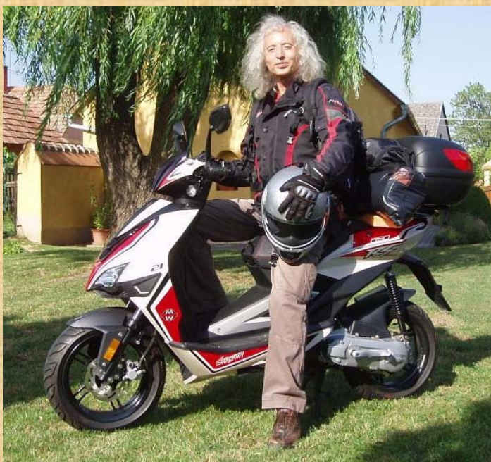
Ich voll ausgerüstet in Ungarn am Vortag

Wer nur den Tourenbericht lesen möchte, kann die Punkte 1 bis 4 einfach überspringen.