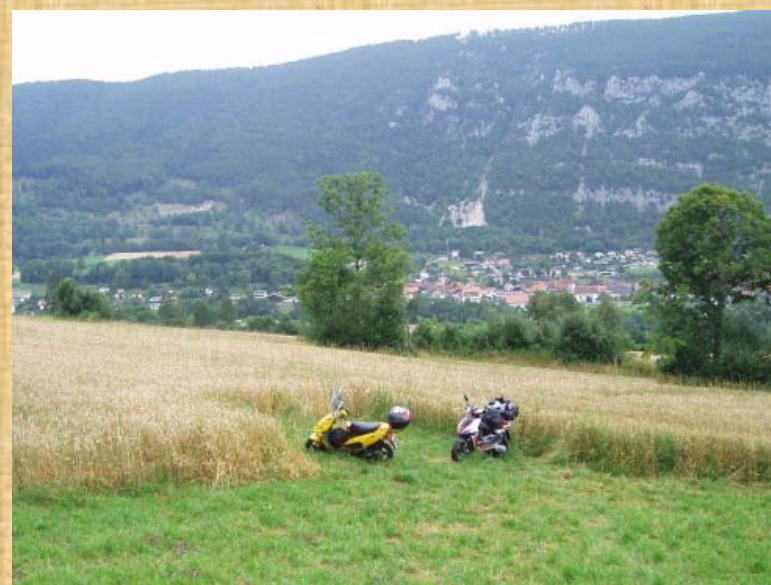
Wildcamping nahe Biel mit schöner Aussicht auf Dorf und Felsen