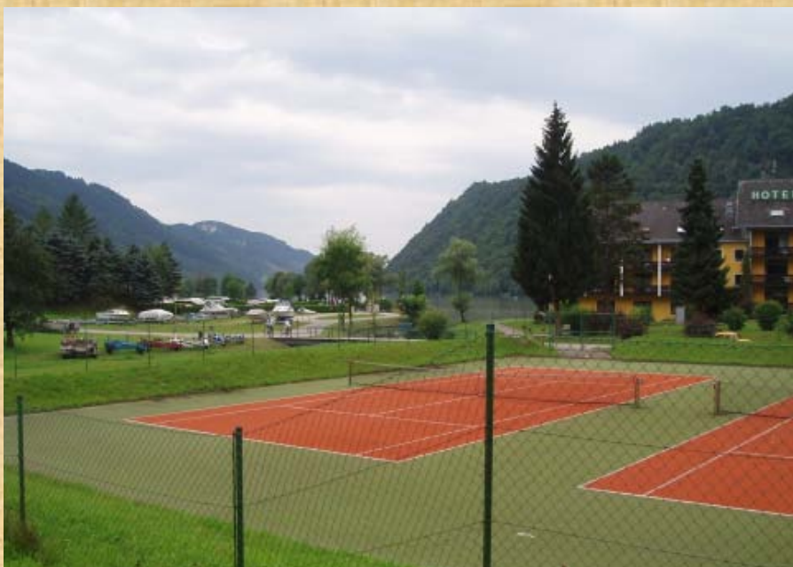
Vor Passau an der Donau fand ich diesen Tennisplatz mit Yachthafen

Das Frühstück nehme ich um 08:00 Uhr ein. Es ist reichlich gedeckt. Es gibt frische Gipfel, Brötchen, Käse, Butter, Marmelade, Kaffee, Tee, Fleisch und Eier waren auch dabei. Zum Abschluss noch einen Nussstrudel. Natürlich habe ich nicht alles probiert, aber den Nussstrudel habe ich verschlungen, denn ich will keine Magenverstimmungen riskieren. Beim Frühstück habe ich auch eine Frau so um 48 kennengelernt. Zu Fuss mit einem grossen Rucksack entlang der Donau ist sie für einige Tage unterwegs, und schafft so um die 25km pro Tag. Also sind neben den Motorrädern, Radfahrern auch Fussgänger entlang der Donau unterwegs!