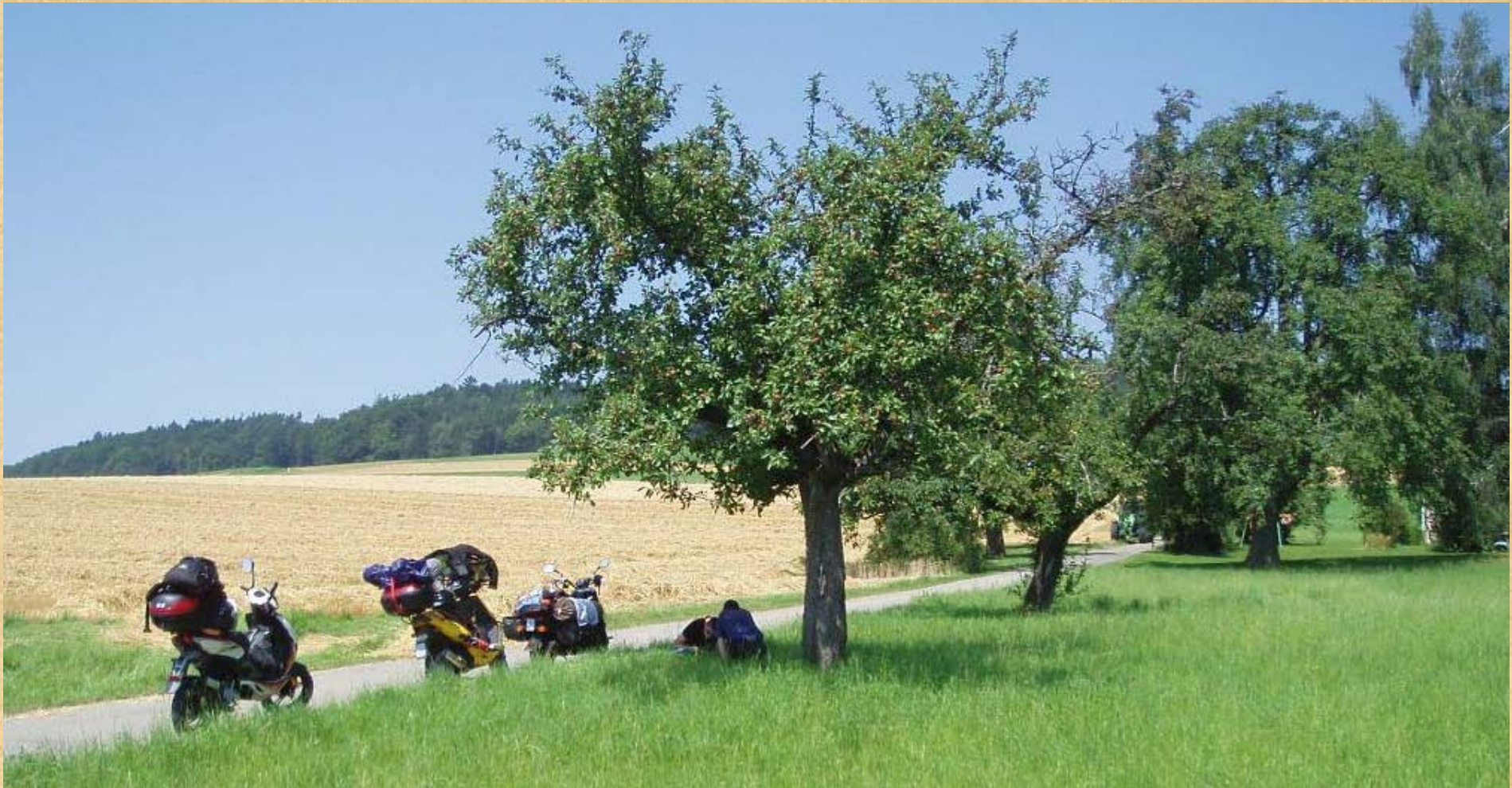
Wieder in Deutschland beim NAVI-Zieleingeben, ohne Zickzackfahrten Schweiz-Deutschland wegen dem Grenzverlauf! Wie beim Picknick, nicht?