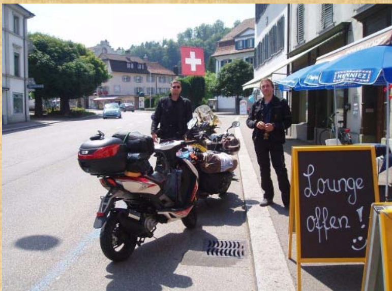
Jetzt endgültig in der Schweiz nach Waldshut