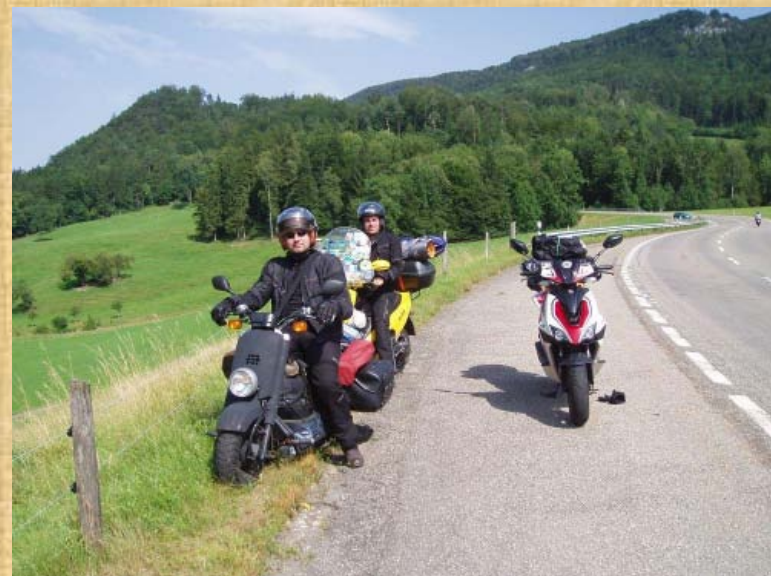
In der Schweiz im Jura wo es auf und ab ging