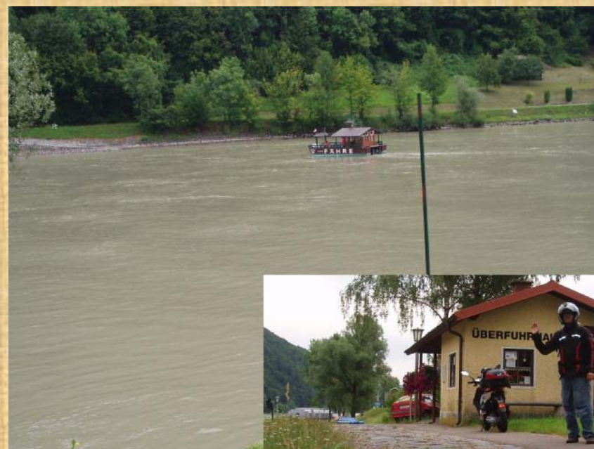
Auch das gibt es, Fähren im Zigarrenschachtelformat

Ich komme immer noch gut voran. Leider regnet es nach Passau bis nach Regensburg 2 ½ Stunden ununterbrochen. Das Regen-Set ziehe ich deshalb noch nicht an. Um 15.00 Uhr treffe ich auf einen Lanzmann. Zuerst dachte ich es sei eine italienische Flagge, doch ich fuhr langsam heran und wir sprachen ungarisch. Es ist unglaublich, dieser nette Herr im zarten Alter von 68 Jahren ist von Szeged (Südungarn) auf dem Weg nach London an die Olympischen Spiele! Diese Begegnung fand auf einsamer Landstrasse statt ohne Zeugen. Ohne Digitalkamera würde mir dies Niemand glauben. Jetzt kommt noch der Hammer. Achtet auf die weiteren Fotos, insbesondere auf den Velorahmen mit dem langen Klebestreifen!