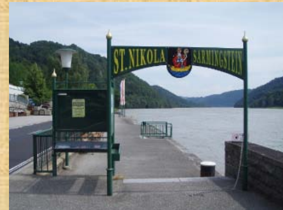
Vor Linz endlich an der Donau geht es Richtung Passau. Hier wendet sich die Donau zwischen den Bergen durch, wo auch die Schiffe noch anhalten.