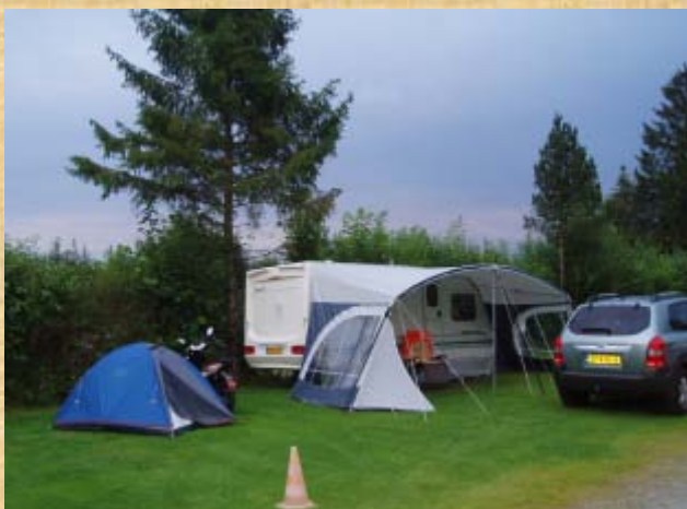
Links ist das blaue Zelt und rechts davon der Roller

Am Nachmittag bei der Aral Tankstelle, D-87616 Marktoberdorf, konnte ich den Roller durch den elektrischen Anlassen nicht starten. War es der Regen? Nun ich drückte den Roller vorwärts und er sprang an. Ich konnte meine Fahrt vorsetzen. Spät um 20:10 kam ich am Dorfende auf dem Campingplatz „Terrassen-Camping am Richterbichl“ an. Der Platz hat für einen Roller und ein kleines Zelt „Zehn fünfzig“ gekostet. Ich dachte mir ist günstig.