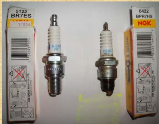
Der Übeltäter, die Kerze links war die falsche!