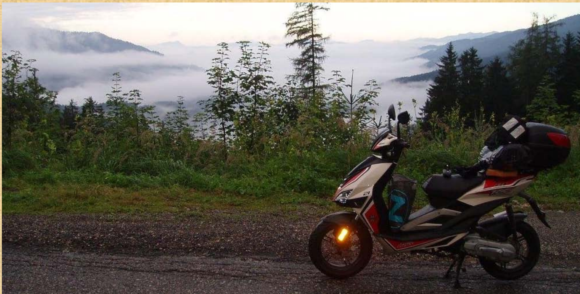
Dies ist das letzte Bild in der Region A-Hartberg um ca. 08:00, ca. 70km vor der Grenze zu Szombathely. Dort war es wieder warm und trocken!

In Österreich hatte es heftig geregnet und ich stand mehrfach vor dem Totalstillstand. Dieses Mal war die alte Bundesstrasse nach Graz gesperrt und die Umleitung erfolgte über die Autobahn. Nun ich fuhr beim Schild Umleitung in der Region A-8775 Kalwang weiter, und fand mich in Front von 2 Österreichischen Polizeibeamten wieder, die vor dem Schild Fahrverbot positioniert waren! Unverblümt forderte ich die beiden Polizisten mit einer Bitte auf: „Wie kann die Österreichische Polizei einem Ungarischen Staatsangehörigen bei der Weiterfahrt behilflich sein, wenn er doch mit dem Roller die Umleitung auf die Autobahn nicht umsetzen darf“? Die Polizisten fragten noch nach einigen Dingen, woher ich komme und wohin ich wollte. Daraufhin sagte der ältere der beiden Polizisten, er werde einfach wegschauen. Ja, wieder ein Beamter mit Herz, der es verdient hätte einen Nobelpreis für humanitäres Handeln überreicht zu bekommen. Ich fuhr dann los. Soweit ich sehen konnte viele Murenniedergänge (Lawinen aus Stein/Erde) habe das Tal und die Bundesstrasse versperrt. Nur auf einem schmalen Streifen konnte ich mit dem Roller durch.