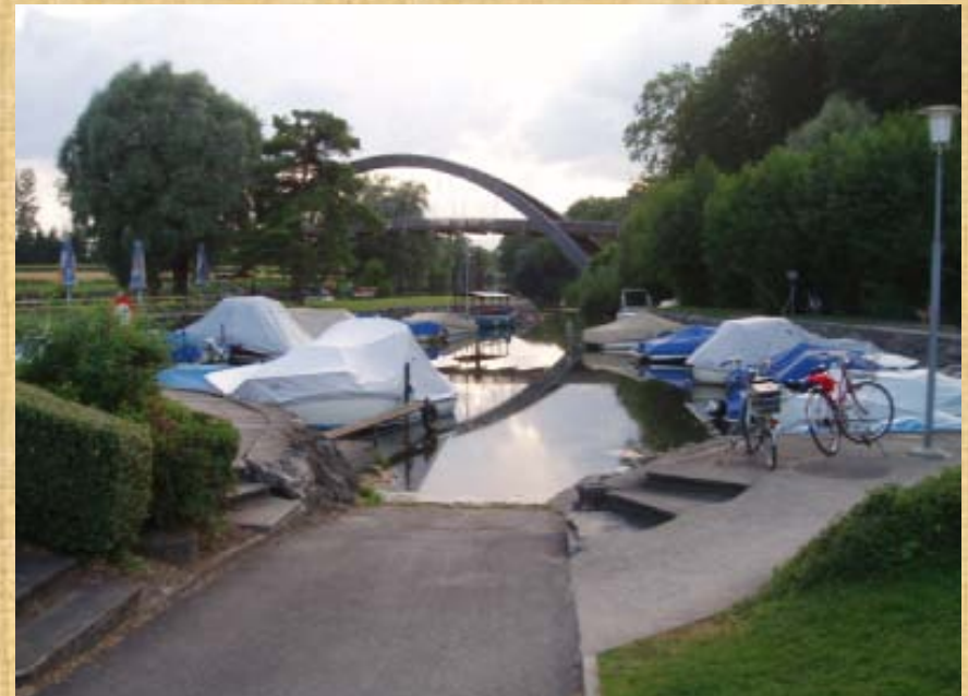
Camping les 3 lacs, in CH-1786 Sugiez. Die Anlage ist gepflegt, hat einen Yachthafen, Schwimmbad. Nur .ca. 10% sind nicht Dauercamper!